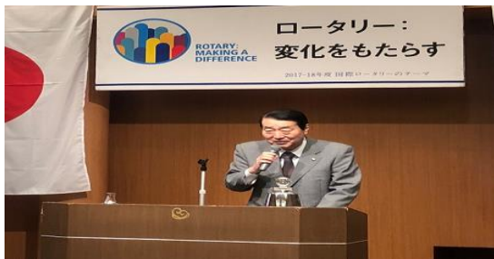
五十嵐清隆伊勢崎市長 様