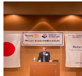
ガバナー補佐挨拶