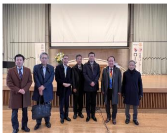
ロータリーデー講演会 2.23