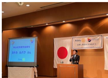
米山記念奨学生ご挨拶