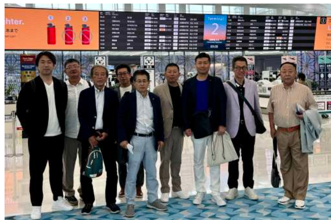
羽田空港 国際線 第2ターミナル