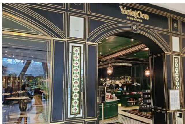
Vioet Oon @ Jewelにて、ニョニヤ料理 (中華とマレーが融合した料理) でシンガポール到着を乾杯