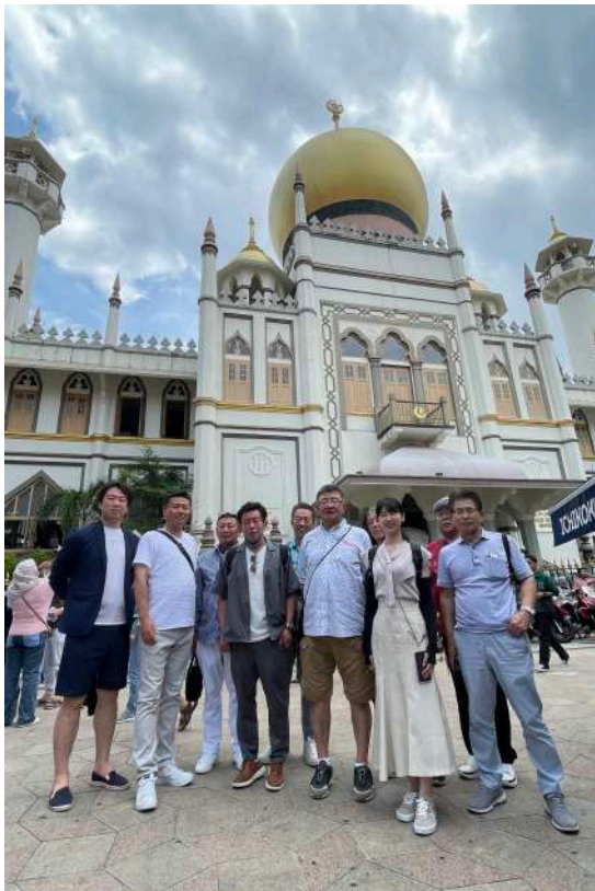
サルタン・モスクはイスラム教徒の活動の中心地 巨大な金のドームと大きな礼拝堂前にて