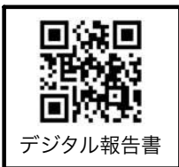
シンガポール国際大会参加ツアー ご参加頂きました皆さまありがとうございました。