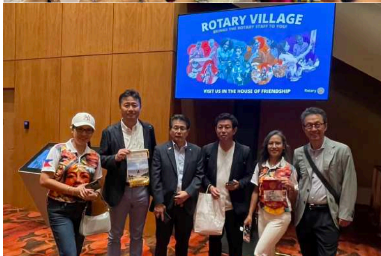
国際交流 クラブバナーの交換