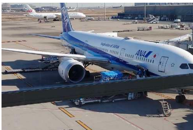
ANA (NH-841)10:55 羽田発