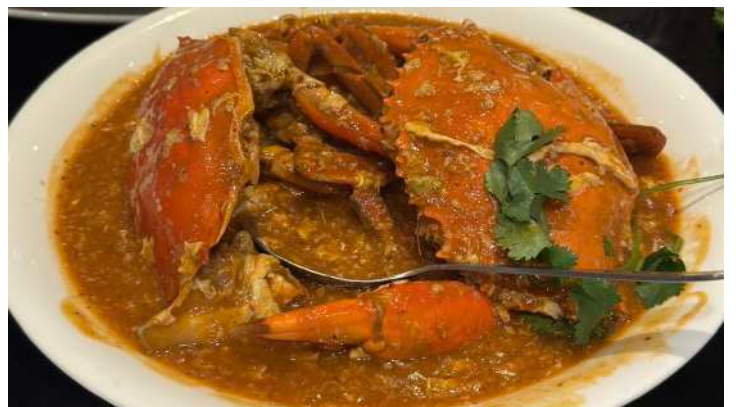
シンガポール名物料理チリクラブ (Palm Beach Seafood)