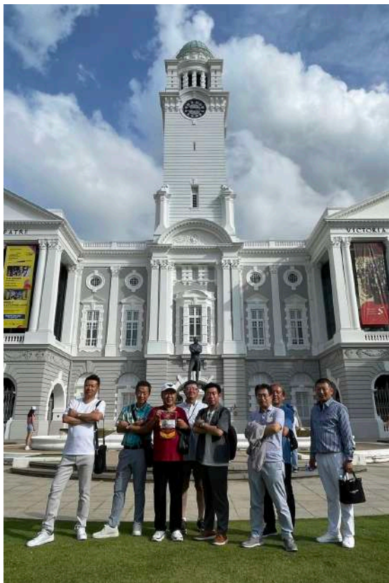
シンガポールの建設者トーマス・ラッフルズ像前