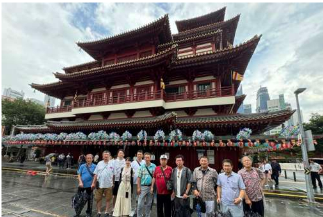
チャイナタウンにある仏牙寺龍華院博物館。 意匠を凝らした内装や仏教美術、数千年を超える文化を今に伝えています。