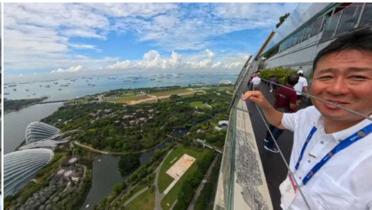
マリーナベイ・サンズ スカイパーク 展望デッキ