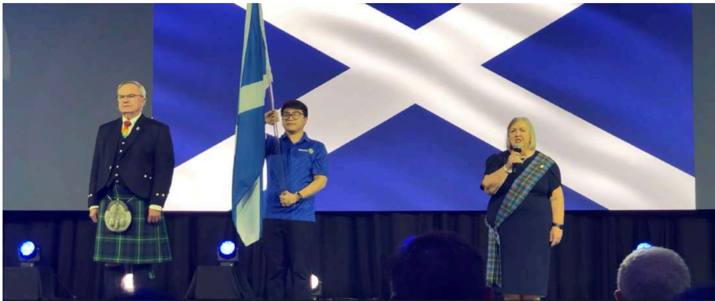
国際大会開会式でのマッキナリーRI会長（左）母国スコットランドの国歌斉唱

South Queensferry ロータリークラブ（スコットランド、ウェストロージアン）