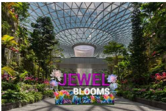
無事にチャンギ国際空港に到着。空港内のJewel (ジュエル) 巨大複合商業施設にて