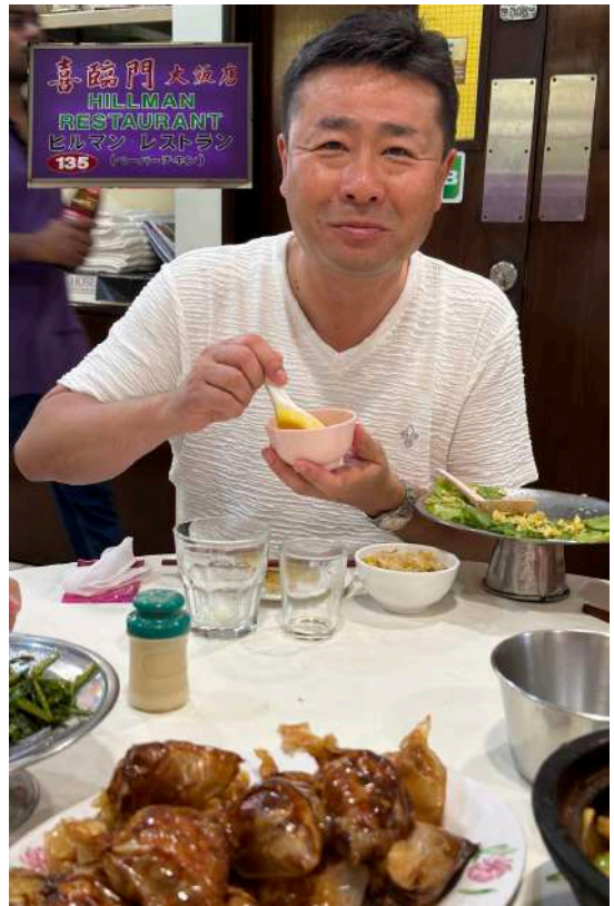
名店ヒルマンで味わうシンガポールグルメ 「ペーパーチキン」