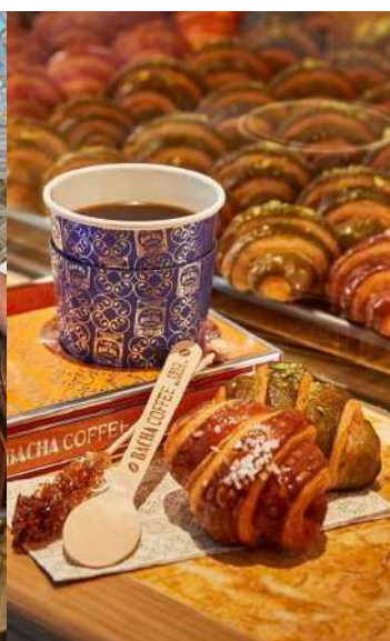
Bacha Coffee コーヒーとサンドイッチで ひとり7,000円！！