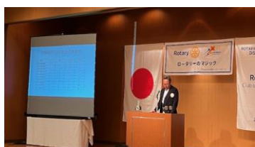
会員増強推進月間卓話